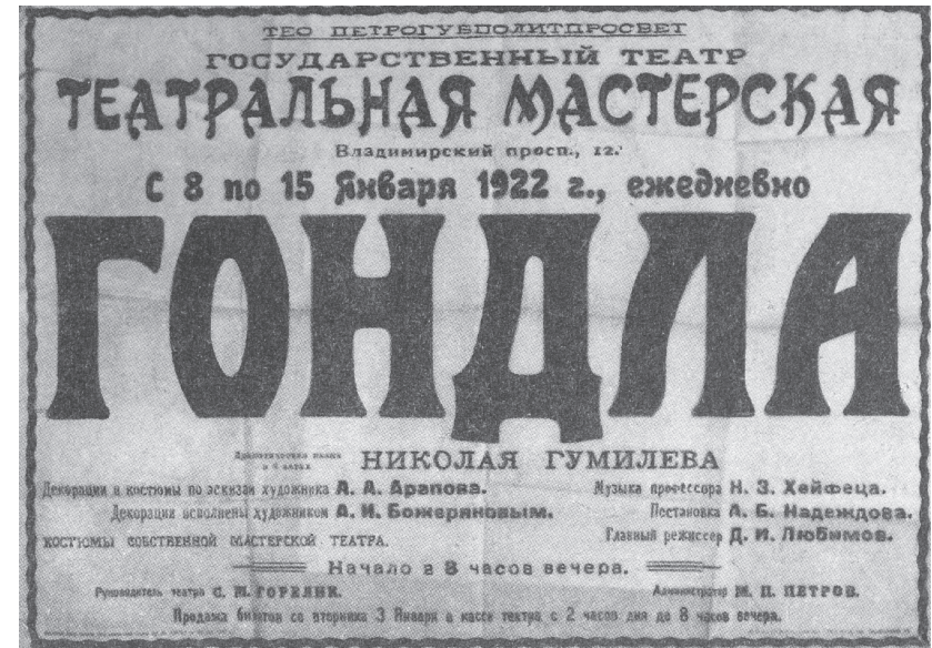
Афиша постановки «Гондлы» в Петрограде