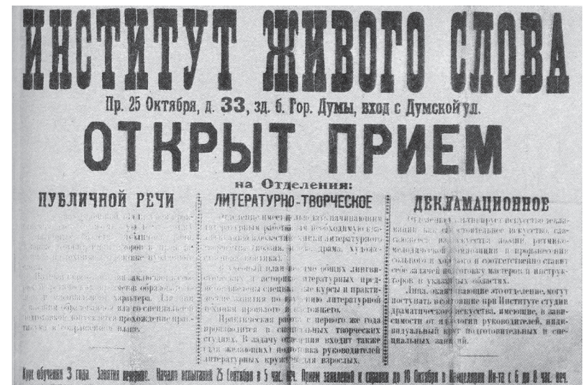
Афиша-объявление «Института живого слова», где преподавал Н. С. Гумилёв